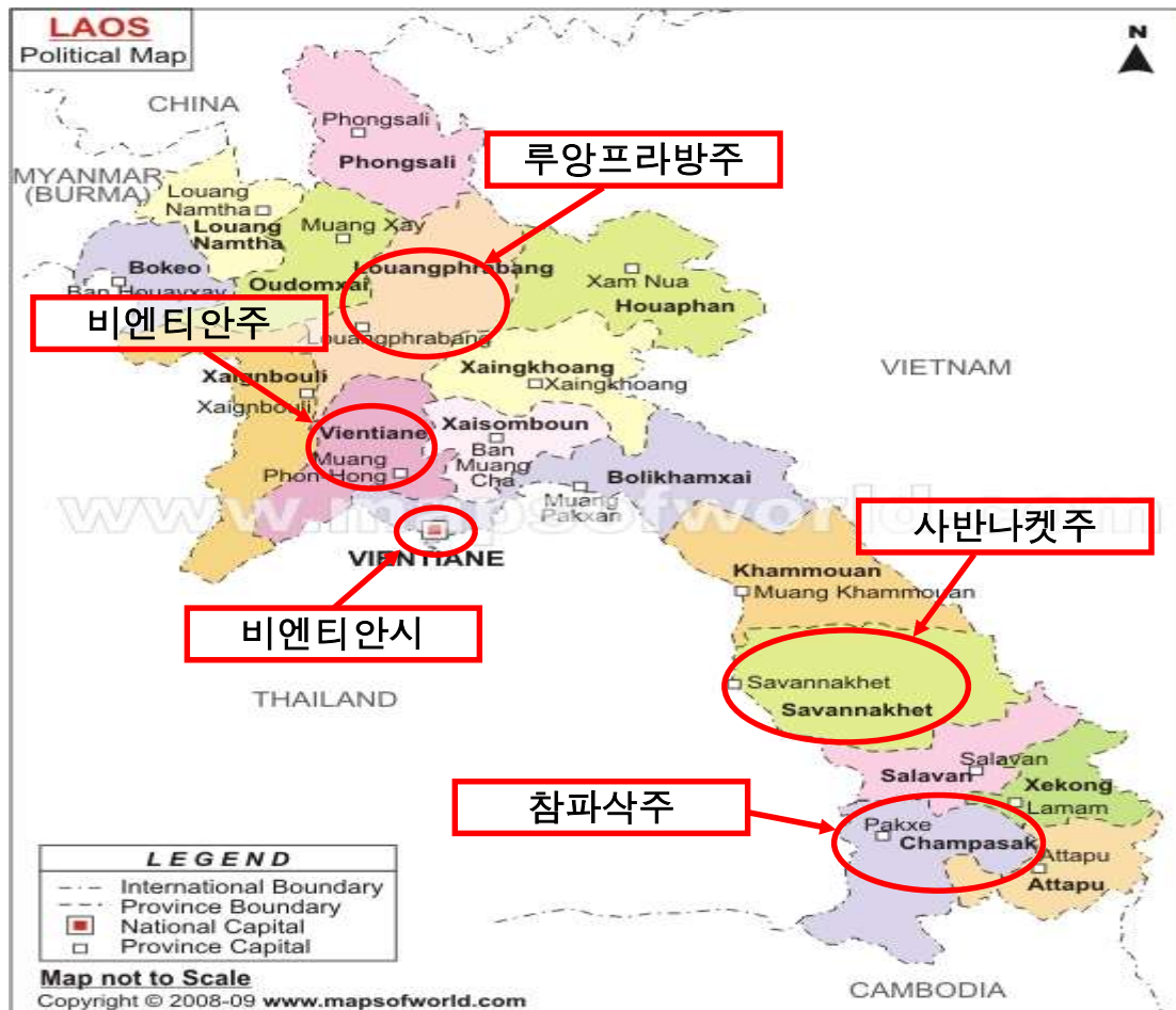
<1차 사업 실시지역>

* 본 사업은 1차 사업 실시지역을 제외한 나머지 주 및 시·도 세무서를 대상으로 함